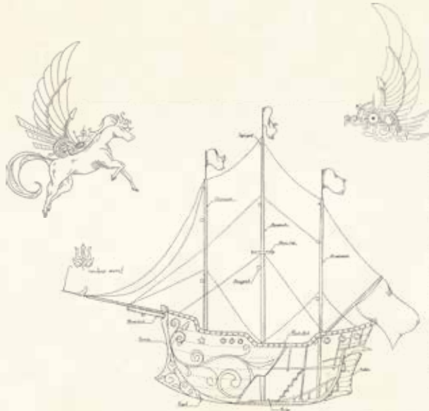
※イラストはすべてイメージです。

全長約220m、約100万個のフルカラーLEDによる大トンネルを抜け、23万灯のLEDが煌めく中庭～大迫力のプロジェクションマッピングゾーンの先に、突如「イグアスの滝」が現れます。日本初「奥行きのあるLEDビジョン」と「ウォータースクリーン プロジェクション」「ミスト特殊効果」「重低音 音響装置」で、今まで体験したことのない圧倒的な臨場感をお楽しみください。