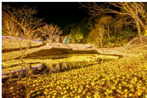
ファンタジーラグーン