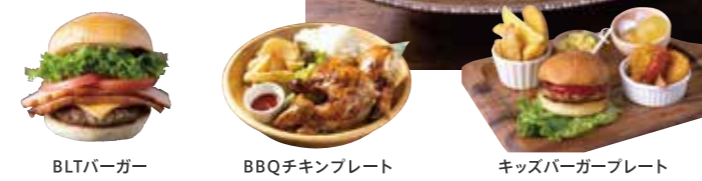
BLTバーガー BBQチキンプレート キッズバーガープレート