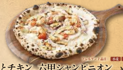
海老とチキン、六甲シャンピニオン ¥1,650

モッツアレラ、ゴルゴンゾーラ、グラナパダーノ、 タレージョの4種類のチーズを使った濃厚ピッツァです。