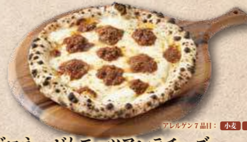
牛肉ボロネーゼとモッツアレラチーズ