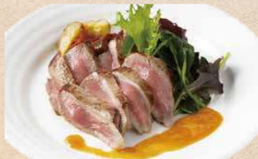
牛ロース肉のタリアータ 淡路玉葱のシャリアピンソース ¥2,200

地鶏を香ばしく焼き上げた一皿。 香り豊かなジェノベーゼソースでお召し上がりください。