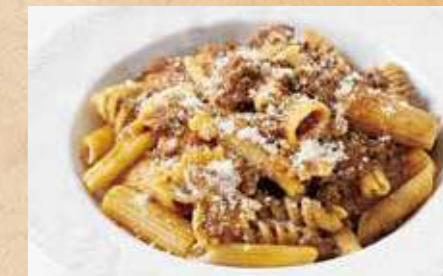
牛肉ボロネーゼの パスタミスタ