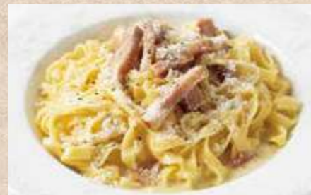
淡路産パスタ 厚切りベーコンのカルボナーラ