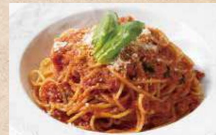
フレッシュトマトと バジリコトマトソース

濃厚なカルボナーラソースが コシと弾力のある淡路産の 平打ちパスタによく絡みます。