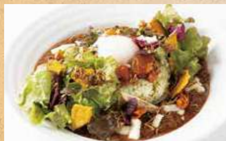
地場野菜と温玉のイタリアンキーマカレー