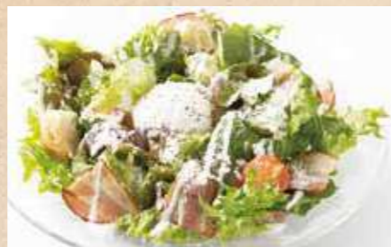
燻しベーコンと温玉の シーザーサラダ