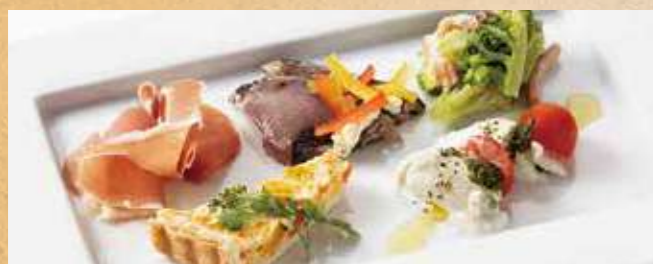
前菜5種盛り合わせ