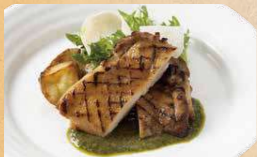
但馬どりのグリル 兵庫県産グリーンリーフのジェノベーゼ ¥1,650

地鶏を香ばしく焼き上げた一皿。 香り豊かなジェノベーゼソースでお召し上がりください。