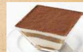
ふわふわティラミス ¥770