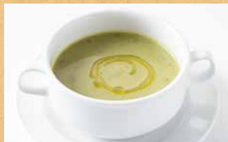
兵庫県産グリーンリーフと 玉ねぎのスープ