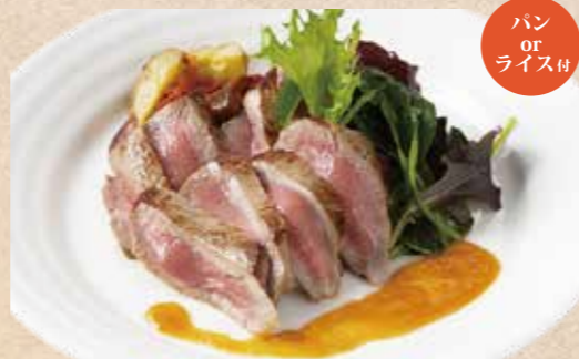
牛ロース肉のタリアータ 淡路玉葱のシャリアピンソース

地鶏を香ばしく焼き上げた一皿。 香り豊かなジェノベーゼソースでお召し上がりください。