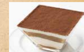
ふわふわティラミス