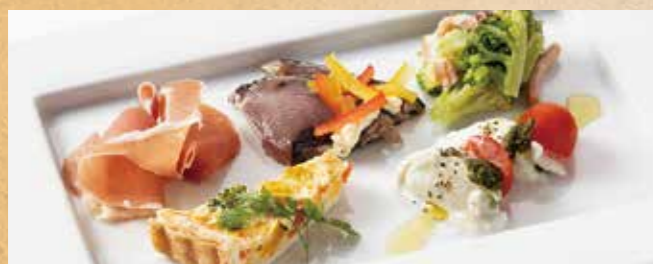
前菜5種盛り合わせ