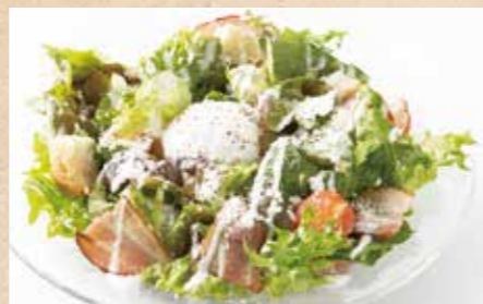
焼きベーコンと温玉の シーザーサラダ