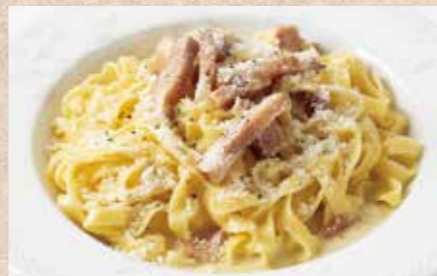
淡路産パスタ 厚切りベーコンのカルボナーラ