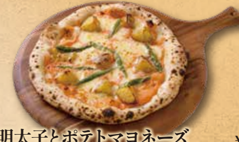
明太子とポテトマヨネーズ

モッツアレラ、ゴルゴンゾーラ、グラナパダーノ、 タレージョの4種類のチーズを使った濃厚ピッツァです。