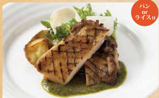
但馬どりのグリル 兵庫県産グリーンリーフのジェノベーゼ