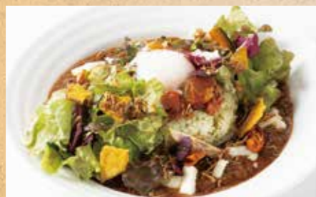
地場野菜と温玉のイタリアンキーマカレー