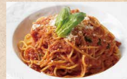
フレッシュトマトと バジリコトマトソース

濃厚なカルボナーラソースが コシと弾力のある淡路産の 平打ちパスタによく絡みます。