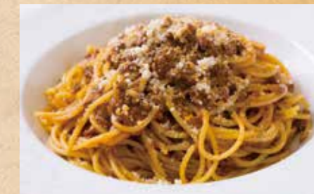
牛肉たっぷりの ボロネーゼ