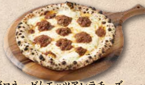
牛肉ボロネーゼとモッツアレラチーズ